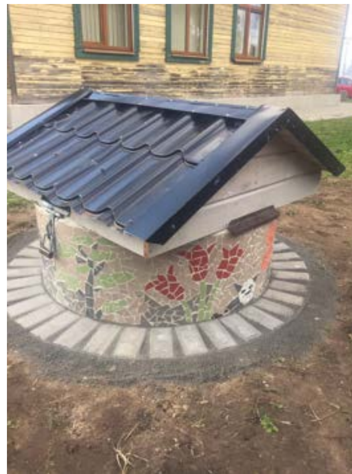
Liepos 1d. užbaigtas meno kūrinys.