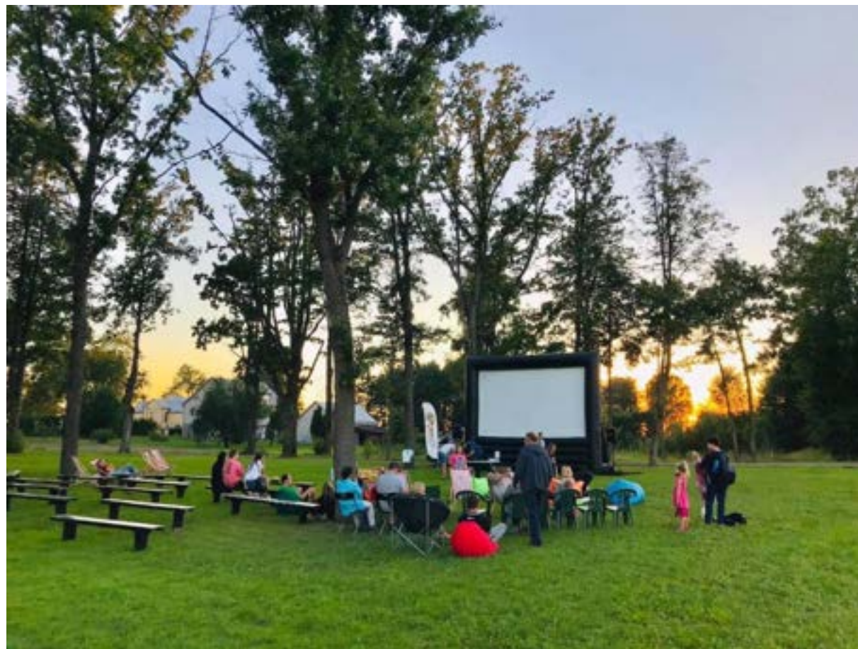
Jaunimo projektas – trys kino vakarai