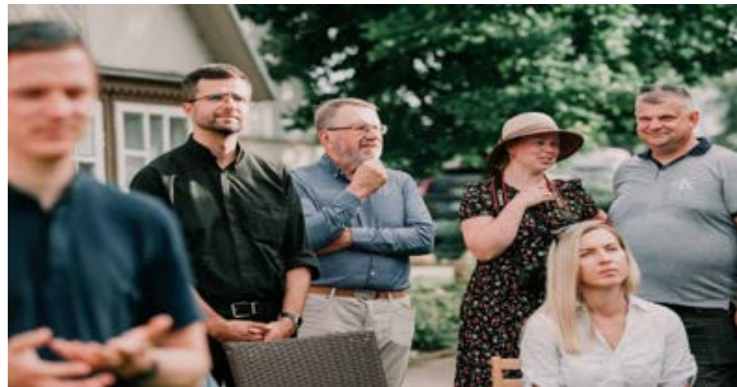
Rugpjūčio 8d. vyko nuostabaus grožio giesmių vakaras "Pilni Dvasios".